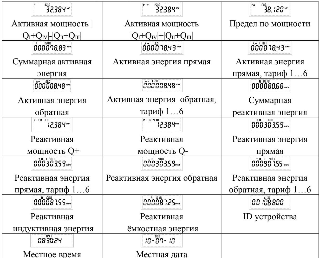
Таблица 9.2 Верхняя строка символов и комбинаций (примеры)

ПРИМЕЧАНИЕ: OBIS код используется всегда